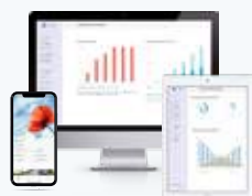
Suite logiciel MyLight Systems